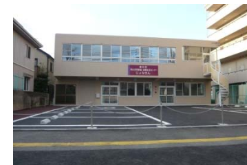
男女共同参画・消費センター