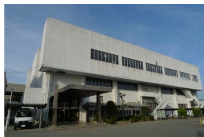
春日市スポーツセンター