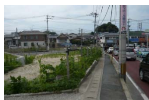
市道小倉紅葉ヶ丘線